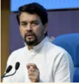
मार्गदर्शक तत्त्वे आणि डिजिटल मीडिया आचारसंहिता) नियम 2021च्या

धार्मिक विद्वेष पसरवण्याच्या उद्देशाने बनावट बातम्या प्रसारित करणाऱ्या 10 यूट्यूब वाहिन्यांवरील 45 व्हिडीओंवर केंद्र सरकारने बंदी घातली आहे. गुप्तचर यंत्रणांकडून मिळालेल्या माहितीच्या आधारे युट्यूबला ही कारवाई करण्याचे निर्देश माहिती आणि प्रसारण मंत्रालयाने दिले आहेत.