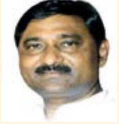
। नवी दिल्ली । महाईन्यूज । प्रतिनिधी ।