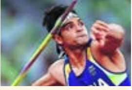
स्टॉकहोम । महाईन्यूज

डायमंड लीग अॅथलेटिक्स : नीरजच्या कामगिरीकडे लक्ष