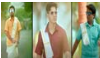
भागांना बॉक्स ऑफिसवर उत्तम प्रतिसाद

ऐतिहासिक चित्रपटांबरोबरच मराठीमध्ये 'टाईमपास ३' सारखे बहुचर्चित चित्रपट देखील प्रदर्शनाच्या मार्गावर आहेत. अशातच आता आणखी एका चित्रपटाची घोषणा करण्यात आली आहे. तो चित्रपट म्हणजे 'बॉईज ३'. या चित्रपटाच्या पहिल्या दोन भागांनी प्रेक्षकांचं भरभरून मनोरंजन केलं. चित्रपटाच्या दोन्ही