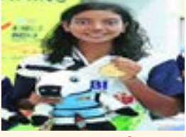
। पंचकुला । महाईन्यूज

अॅथलेटिक्स, जलतरणात छाप; पाच सुवर्णपदकांसह एकूण आठ पदकांची कमाई