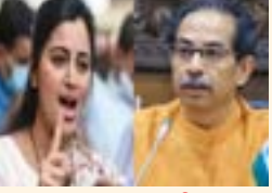
। नागपूर । महाईन्यूज ।

मुख्यमंत्र्यांच्या आदेशानेच पावरचा दुरुपयोग, हनुमानाने त्यांना सद्बुद्धी द्यावी - नवनीत राणा