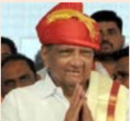
एकीकडे मागील काही दिवसांपासून राष्ट्रवादी काँग्रेसच्या काही नेत्यांकडून

राष्ट्रवादी काँग्रेसचे अध्यक्ष शरद पवार यांच्याकडून राज्यातील अखिल भारतीय ब्राह्मण महासंघासोबतच विविध ब्राह्मण संघटनांना ब्राह्मण संघटनांना चर्चेसाठी निमंत्रण देण्यात आले आहे. आज (शनिवारी) पुण्यातील निसर्ग मंगल कार्यालय येथे सायंकाळी ५ वाजता या बैठकीचे आयोजन करण्यात आले आहे.